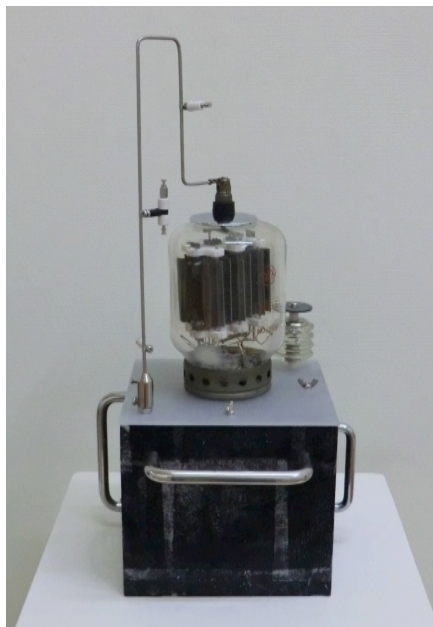
「原子炉」 ミクストメディア / 2010